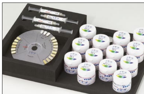
Cofano Chroma Concept