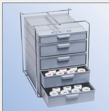
COMPACT-Set, REF 270-112-00