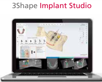
3Shape Implant Studio

Für die Herstellung passgenauer und präziser Planungs-, Diagnostik-, Arbeits- und Alignermodelle.