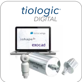
CAD/CAM Komponenten Produkte für den digitalen Workflow Download Datensätze 3Shape, exocad und dentalwings