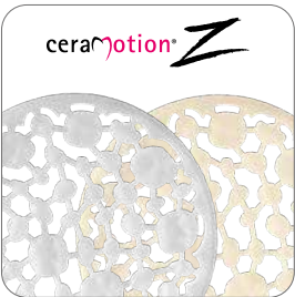
Zirkonoxidblanks Hochleistungskeramik aus Zirkonoxid