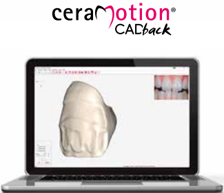
ceraMotion ® CADback Design-Software für die maßgeschneiderte Gestaltung von Gerüsten für die Micro- Layering-Technik.