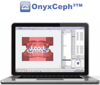
OnyxCeph 3TM der Inbegriff dentaler Imaging Software.

Steigen Sie mit professioneller Planungssoftware in die digitale Welt ein und machen Sie Ihre Arbeitsabläufe für das digitale Zeitalter fit.