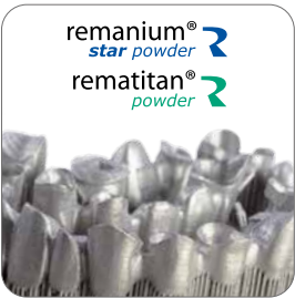
Laser-Schmelz-Pulver Laserschmelztechnologie mit den besten Werkstoffen