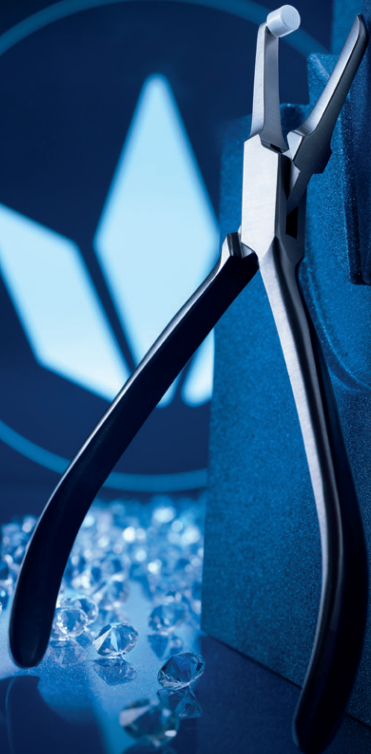
OLIVER-JONES BAND-ABNEHMEZANGE REF 026-347-00