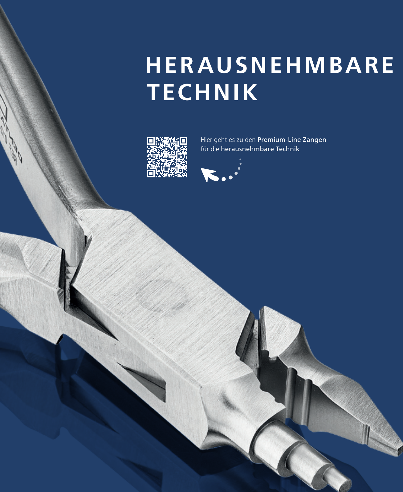
YOUNG SCHLAUFENZANGE REF 012-074-00