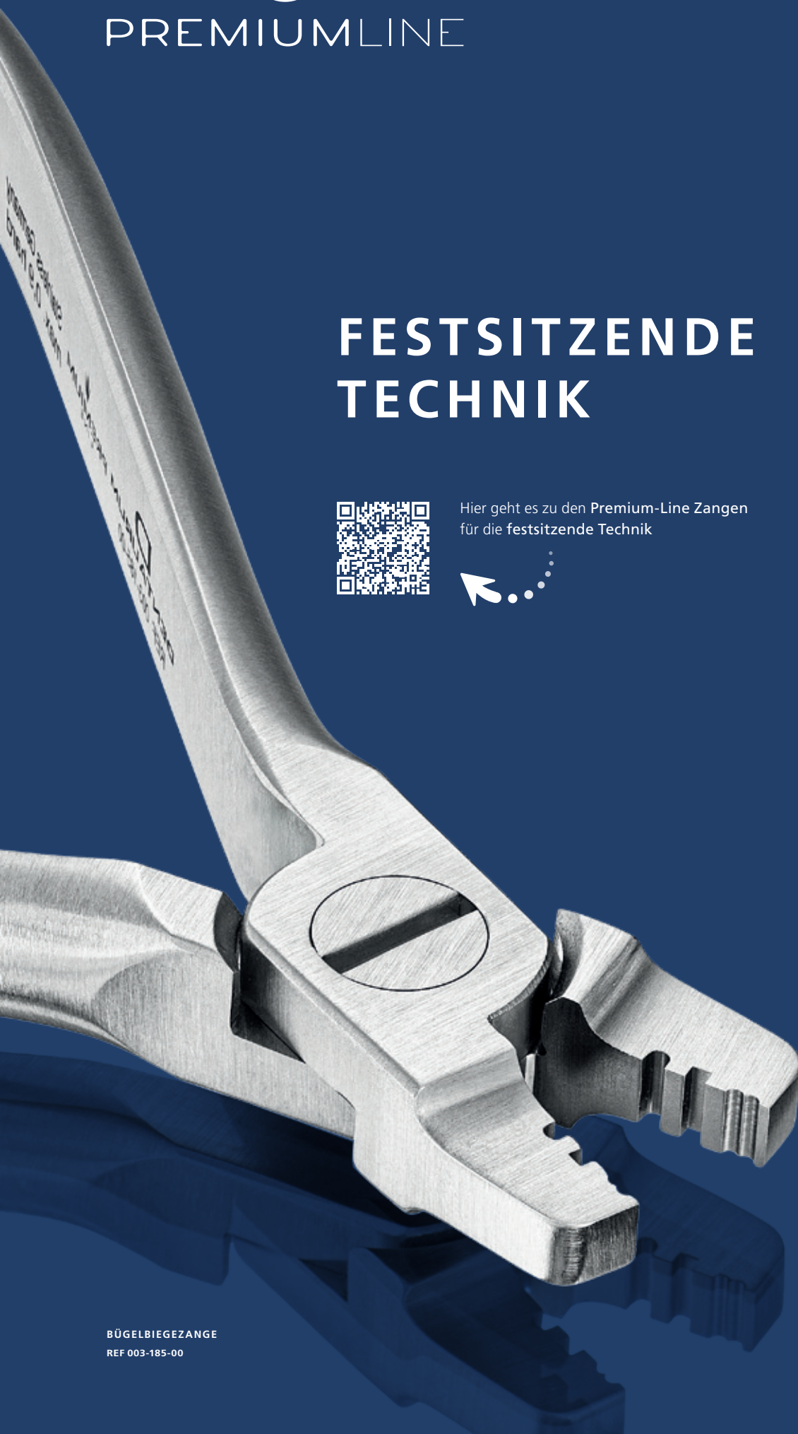
BÜGELBIEGEZANGE REF 003-185-00