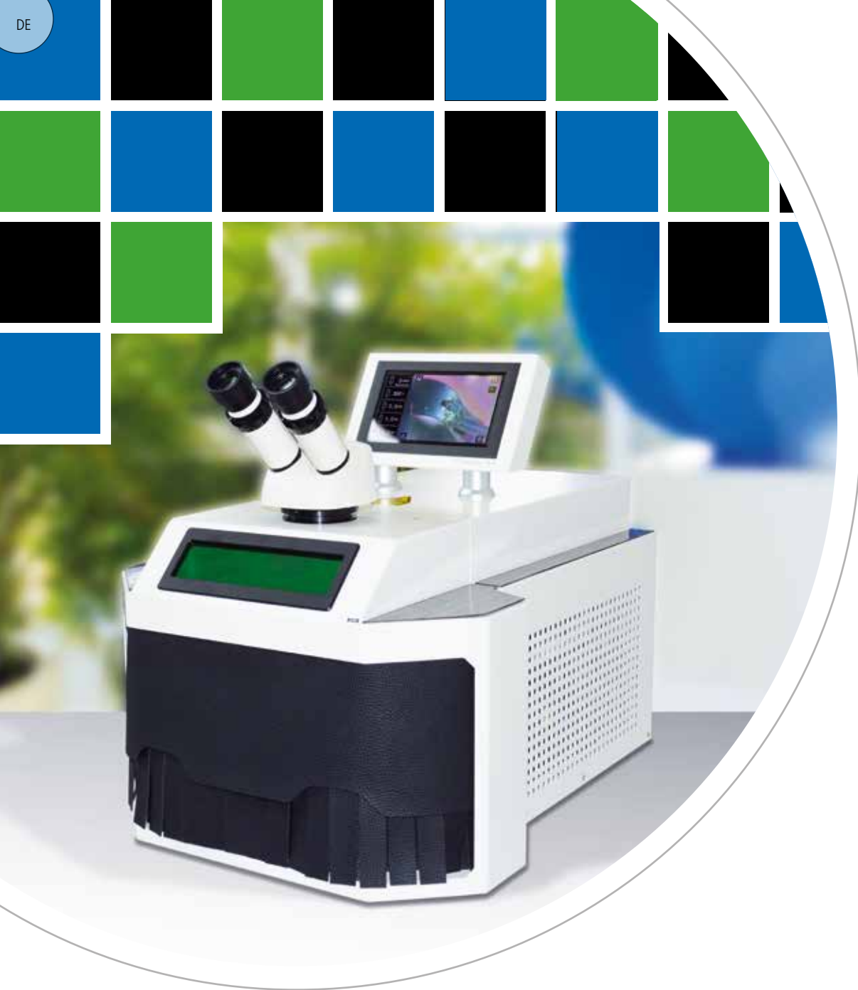
Laser Welder SL10 von Siro Lasertec